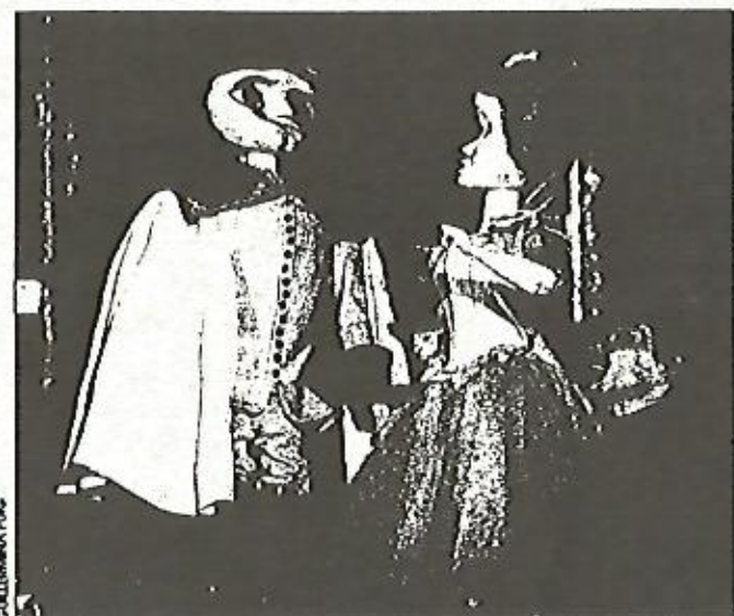
El encanto de las muñecas accionadas a mano

Actos en el Apostolado del Mar. — Hoy, festividad de la Virgen del Carmen, el Apostolado del Mar organiza estos actos: 5.30 de la tarde, partido de fútbol entre marinos mercantes y pescadores en el campo del C. F. Barceloneta. A las 8, misa en la parroquia de Santa María de Cervelló (Almirante Cervelló, 8). A las 9, cena fría en los locales